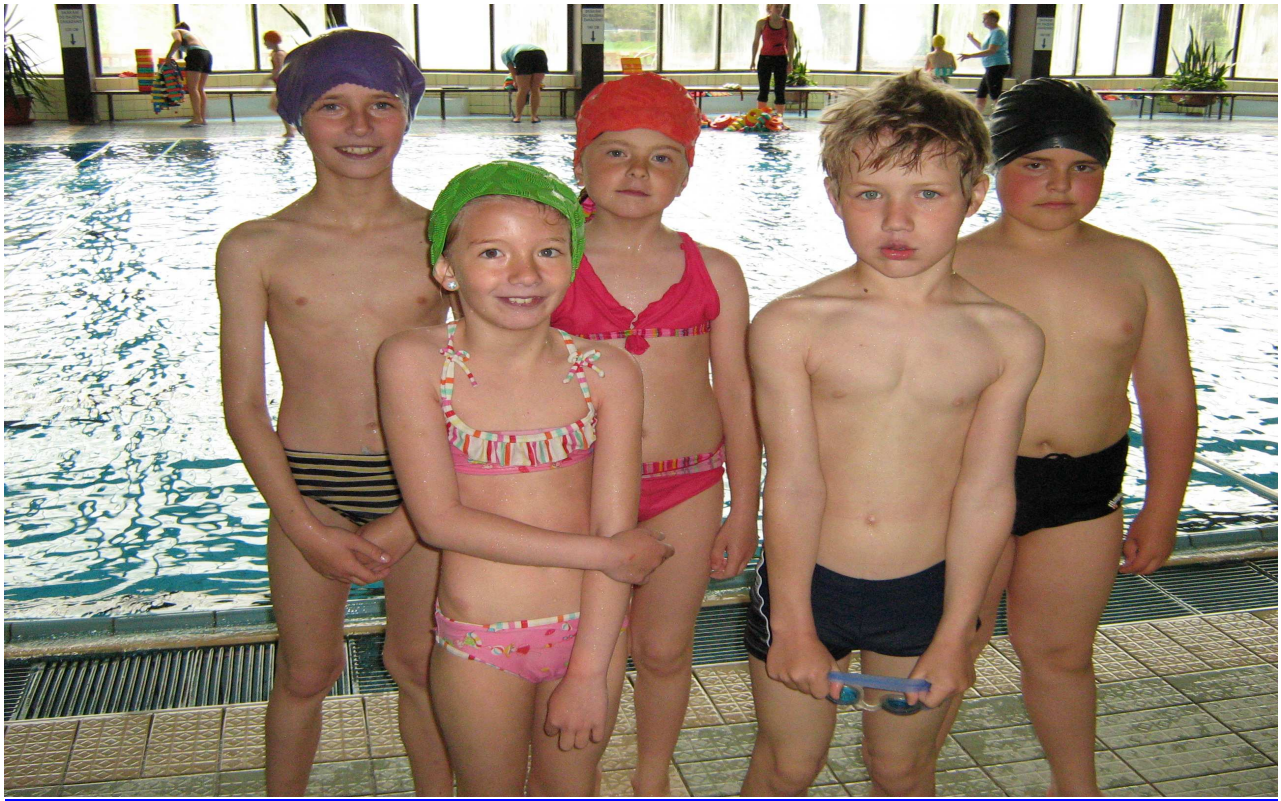
Žáci druhého a třetího ročníku absolvovali výuku plavání v bazénu v Domažlicích.