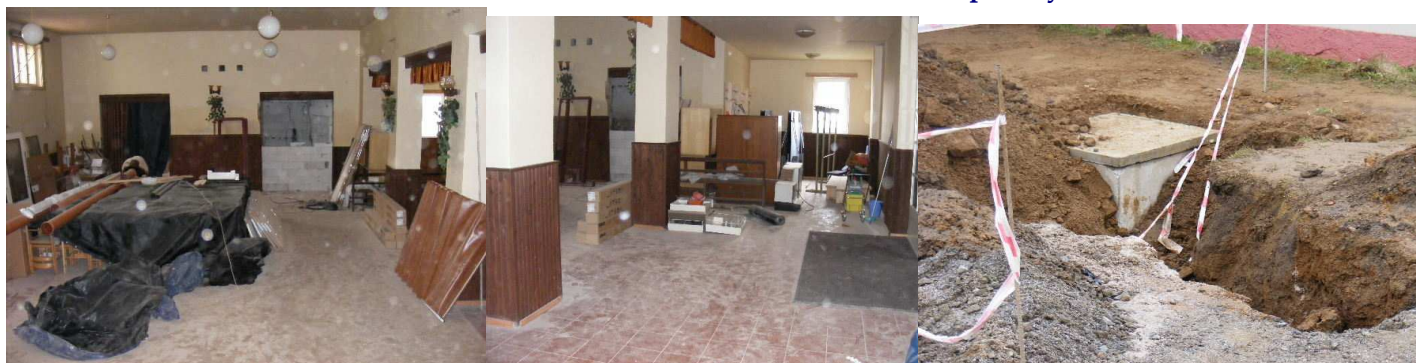
Kulturní dům před výstavbou restaurace v roce 1974