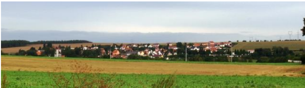
Pohledově exponovaná lokalita R02-BO