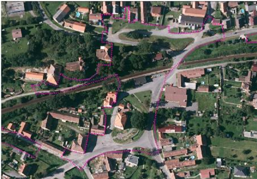
U2 – prostor hradecké návsi