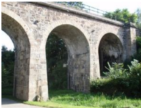
K4 – viadukt v údolí Touškovského potoka

Dále ÚP vymezuje tři urbanisticky cenné prostory důležité pro zachování obrazu obce (U1-U3), popisuje hodnoty jednotlivých míst a stanovuje ochranná opatření. Jedná se o veřejná prostranství, ve kterých je zachována původní urbanistická struktura sídla, fronty zástavby v dominantních pozicích či nedílné spojení zástavby s krajinou tvořící pro dané místo charakteristický vizuální celek. Duch těchto prostorů by měl být zachován a rozvíjen tak, aby byly podpořeny všechny jeho funkce. Doporučeny jsou proto veškeré úpravy kultivující parter těchto prostranství, sadovnické úpravy apod..