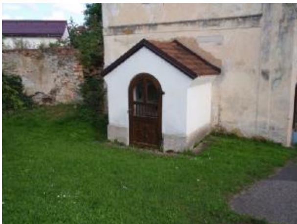
K3 – kaple před usedlostí č.p. 28