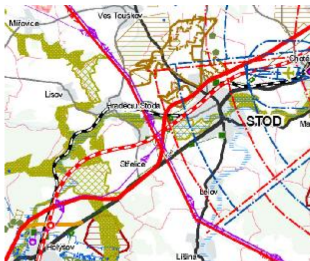
Výřez z výkresu Uspořádání území kraje ze ZÚR PK (vlevo)