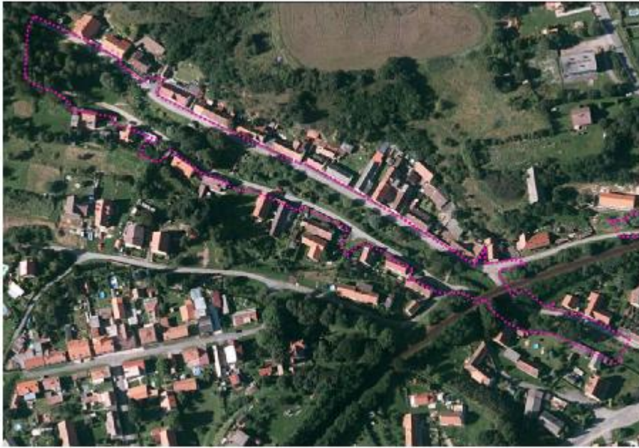
U1 – prostor údolí Touškovského potoka v Hradci