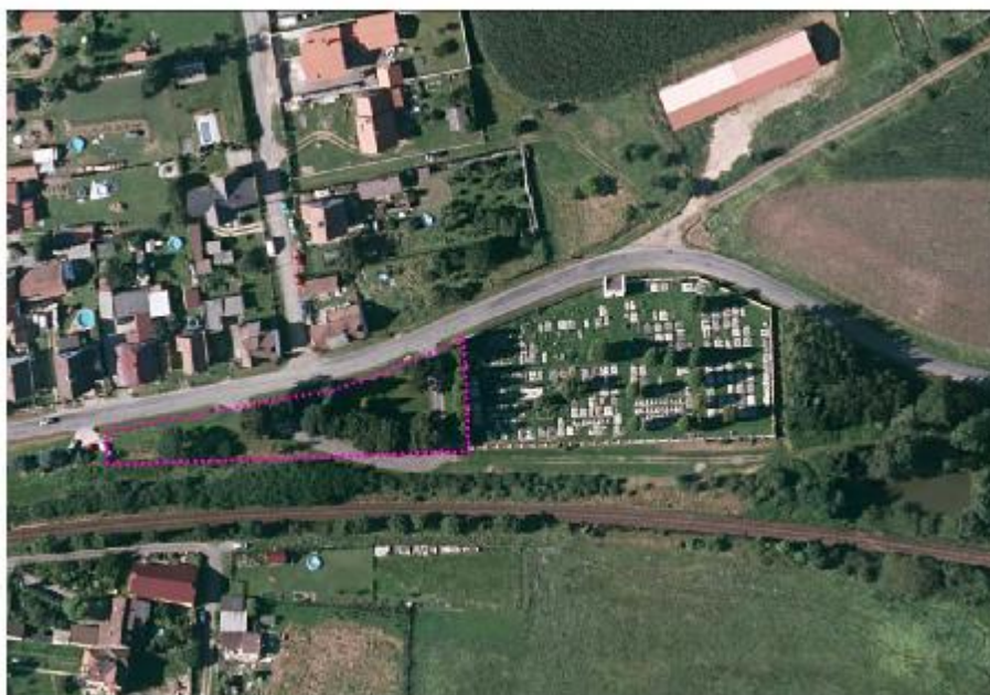
U3 – předprostor místního hřbitova

V řešeném území jsou evidovány tyto archeologické lokality (naleziště a zóny – území s archeologickými nálezy (ÚAN I.):