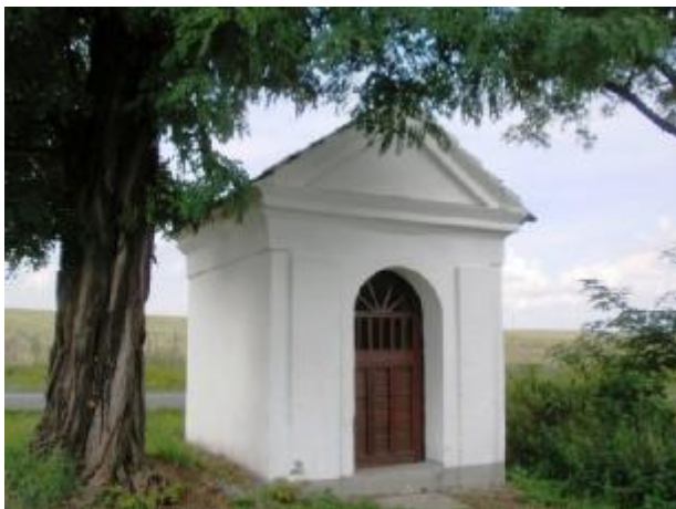
K1 -kaple při silnici spojující Hradec se Stodem

jsou kříže, boží muka, kapličky, pomníky, solitérní kameny, technické stavby a objekty venkovských usedlostí se zachovanými prvky tradiční architektury.