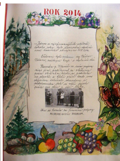
Náhled do kroniky obce Hradec