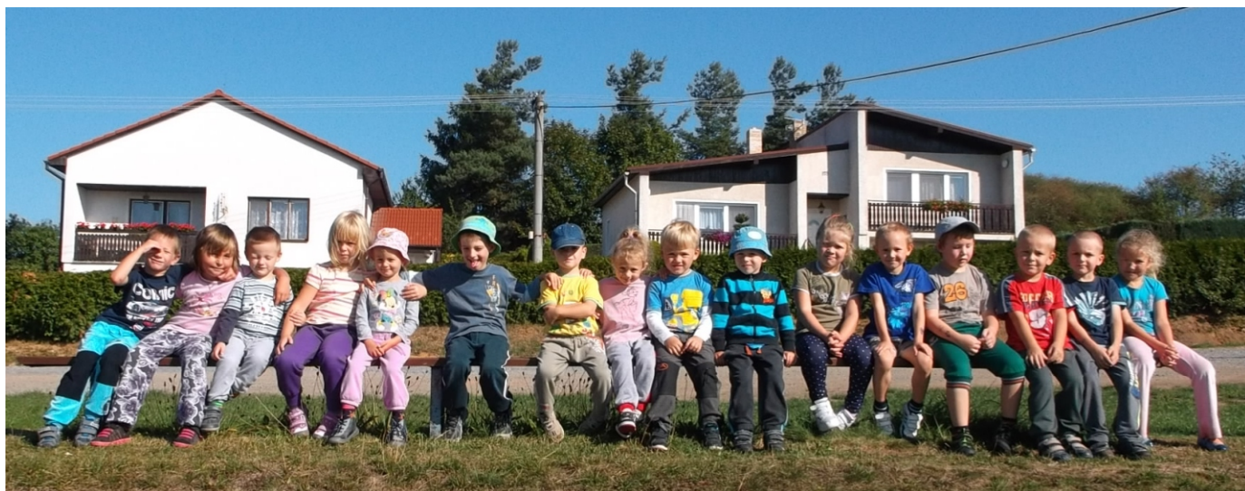
Děti z MŠ v Hradci v novém školním roce 2015/2016