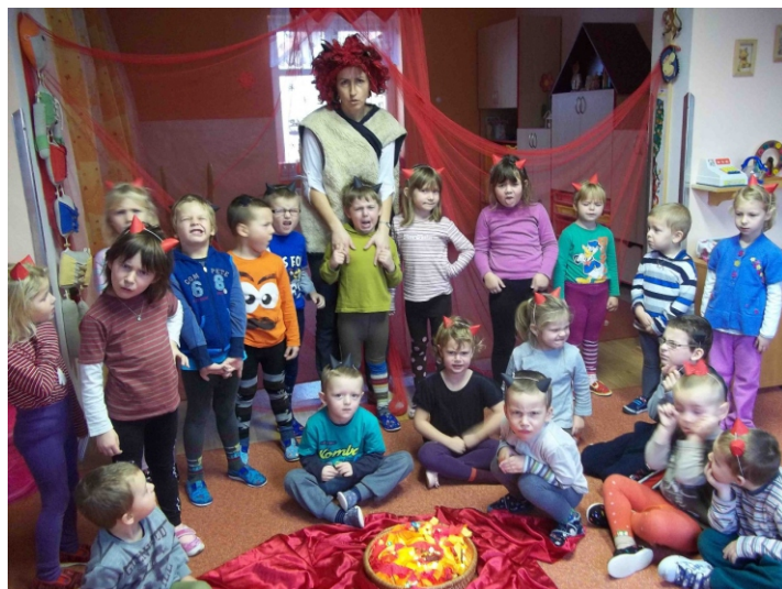
S čerty nejsou žerty