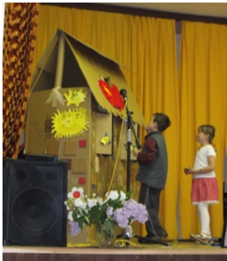
Pohádka o Perníkové chaloupce

Myslivecké sdružení „Háj“ Hradec hledá nájemce na provoz Myslivny