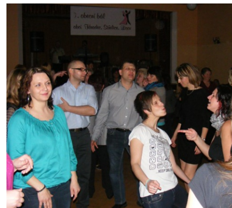
Fotografie z 3. obecního bálu