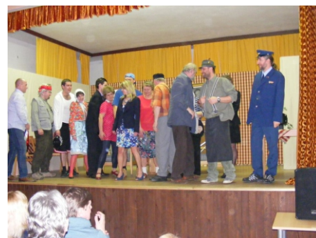
Ukázka z divadelního představení ochotnického spolku „Kolofantí“ z Kolovče.