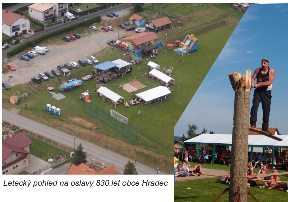
Letecký pohled na oslavy 830.let obce Hradec